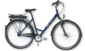
Modell TOUR Y