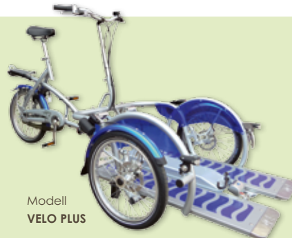
Modell VELO PLUS